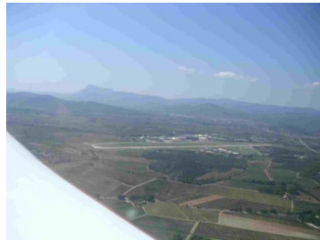
La piste de Cuers

Déjeuner au resto, plein d'essence, passage à l'aéroclub pour consulter la météo qui s'annonce mauvaise à partir de Lyon.