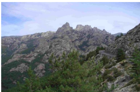
Les aiguilles de Bavella

Remontée vers notre gîte par Sotta. Nous dînons à Lévie.