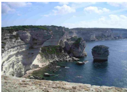
Le grain de sable

Arrivée au gîte vers 23h30. Dossalage obligatoire avant d'aller au lit.