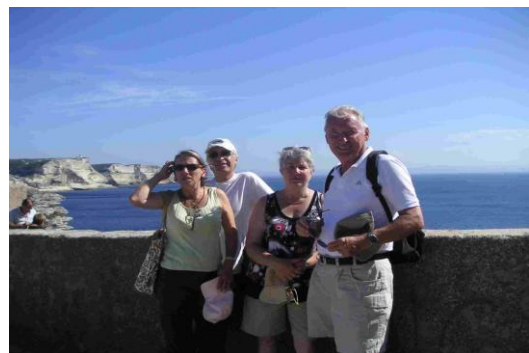
L'équipage à Bonifacio