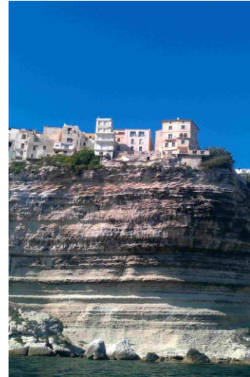
Les falaises et la vieille ville

Il est 17h30, il faut trouver une plage, nous nous éloignons en voiture de 10 km, dans un coin perdu avec des paillotes, nous crapahutons un peu à pied, pas de vestiaire, pas de douche mais la nature à l'état pur, (cependant il reste quelques subsides des pique-niques et des mégots). Mais quel bonheur la plage pour les attardés, l'eau est à 28°C., Nous repartons "salés comme une bacalau portugaise" pendant le coucher du soleil, arrêt sur les hauteurs pour admirer Bonifacio avec l'allumage des lampadaires au soleil couchant, que du bonheur !