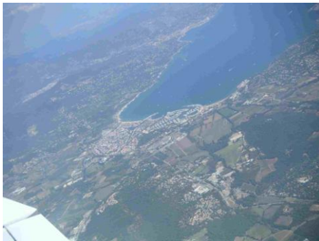
La baie de St Trop'