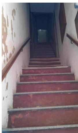
Un escalier d'immeuble