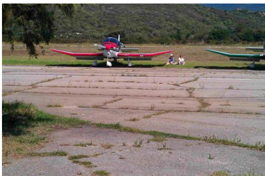
Le PH à Propriano

Un bon voyage, plein de bons souvenirs et nous sommes prêts à repartir, à voir en 2012.